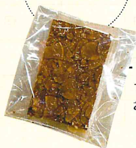
ハニー フロランタン