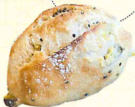
さつまいも フランス