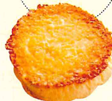
枝豆チーズ おやきパン